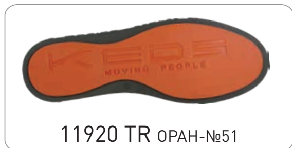
11920 TR ОРАН-№51