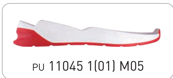
PU 11045 1(01) M05