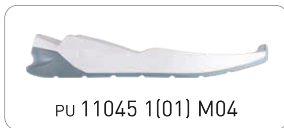
PU 11045 1(01) M04