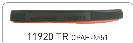
11920 TR ОРАН-№51