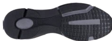
8802 TR ЧЕР-СЕР