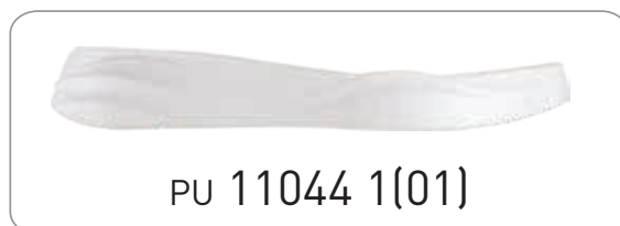
PU 11044 1(01)