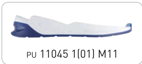
PU 11045 1(01) M11