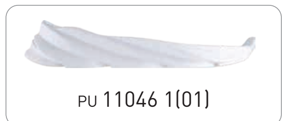
PU 11046 1(01)