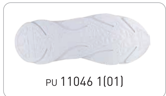
PU 11046 1(01)