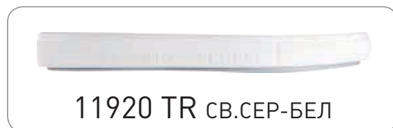
11920 TR СВ.СЕР-БЕЛ