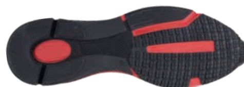
8802 TR ЧЕР КРАС