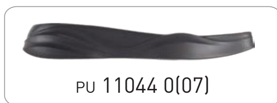
PU 11044 0(07)