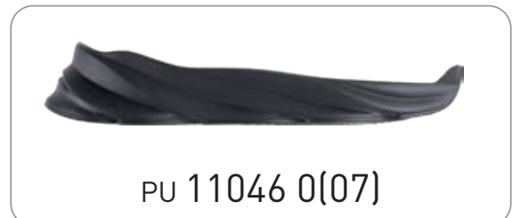
PU 11046 0(07)