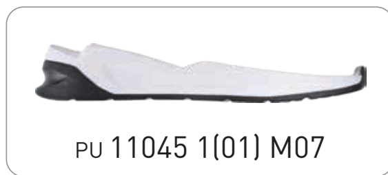
PU 11045 1(01) M07