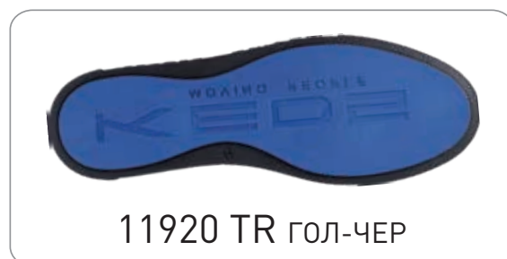
11920 TR ГОЛ-ЧЕР