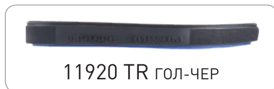
11920 TR ГОЛ-ЧЕР