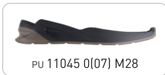
PU 11045 0(07) M28