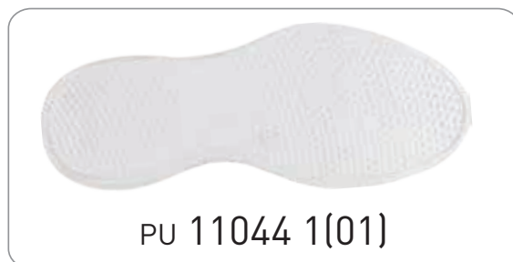
PU 11044 1(01)