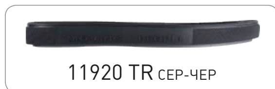
11920 TR СЕР-ЧЕР