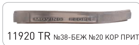
11920 TR №38-БЕЖ №20 КОР ПРИТ