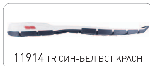
11914 TR СИН-БЕЛ ВСТ КРАСН