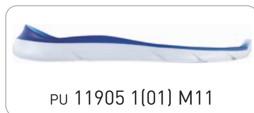
PU 11905 1(01) M11