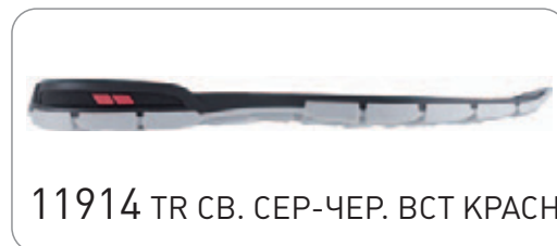
11914 TR СВ. СЕР-ЧЕР. ВСТ КРАСН