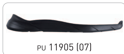
PU 11905 (07)