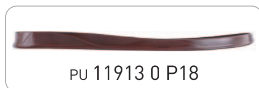
PU 11913 0 P18