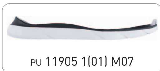
PU 11905 1(01) M07