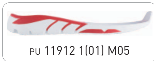
PU 11912 1(01) M05