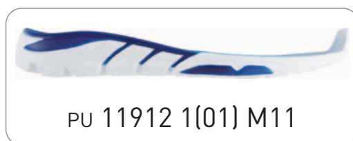
PU 11912 1(01) M11