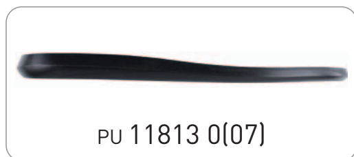
PU 11813 0(07)