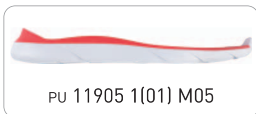
PU 11905 1(01) M05