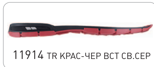
11914 TR КРАС-ЧЕР ВСТ СВ.СЕР