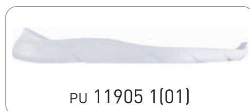
PU 11905 1(01)