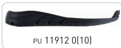
PU 11912 0(10)