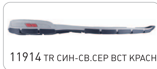
11914 TR СИН-СВ.СЕР ВСТ КРАСН