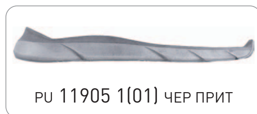
PU 11905 1(01) ЧЕР ПРИТ