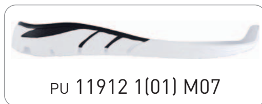
PU 11912 1(01) M07